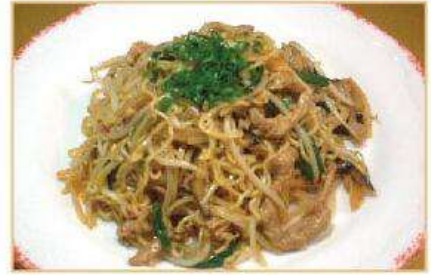
◆豚肉とニラの 上海焼きそば 930円