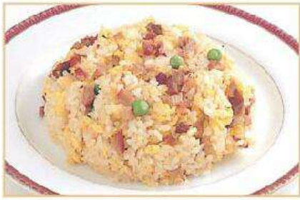
◆チャーシュー入り 炒飯 850円