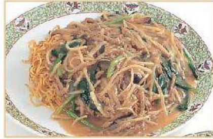
◆牛肉入り焼きそば 900円