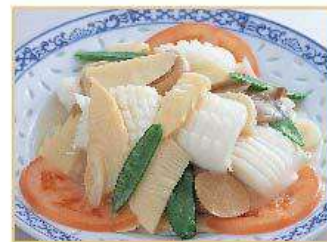
紋甲イカと野菜の塩味炒め