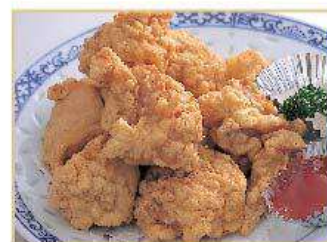
鳥肉の骨なし唐揚げ