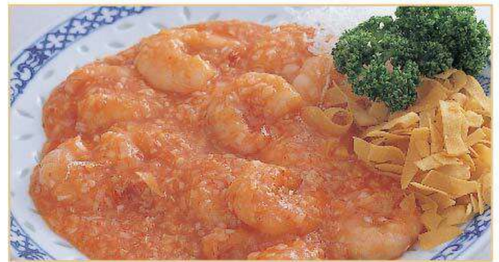
小えびのチリソース