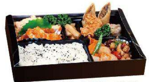
※写真は幕の内弁当の一例です。