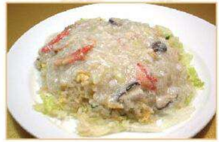
◆ふわふわカニあんかけ 炒飯 1,100円