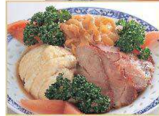
三種冷菜の盛り合わせ