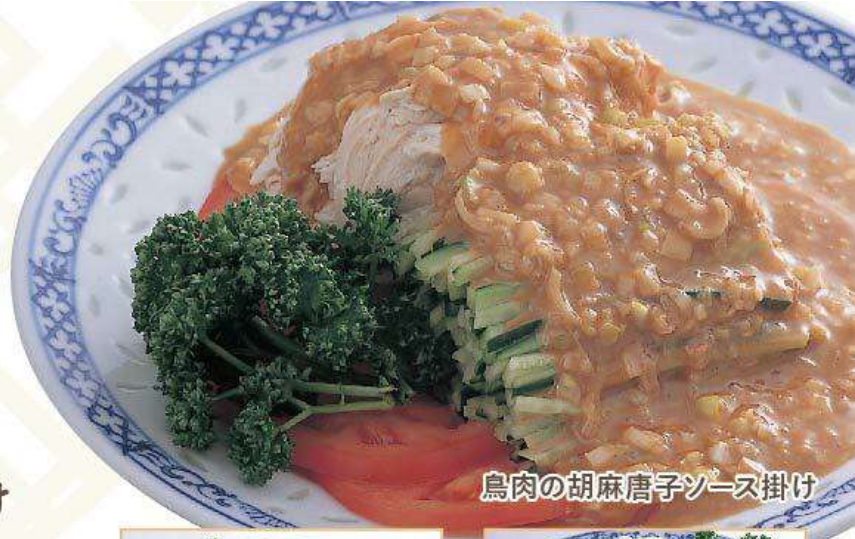
鳥肉の胡麻唐子ソース掛け