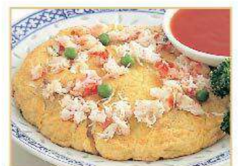
カニ肉入り玉子炒め