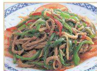
豚肉とピーマンの細切り炒め